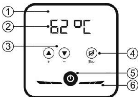
Рисунок 2. Панель управления

Рисунок 2: 1 – Корпус панели управления, 2 – индикация температуры, 3 – установка температуры, 4 – включение/выключение режима «Eco», 5 – включение/выключение прибора, 6 – индикация режима нагрева.