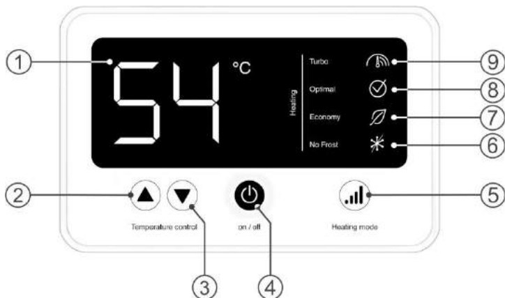
Рисунок 2. Электронная панель управления

Рисунок 2: 1 – LCD дисплей, 2 – кнопка «▲» Temperature control / увеличение температуры нагрева, 3 – кнопка «▼» Temperature control / уменьшение температуры нагрева, 4 – кнопка «on/off» / вкл./выкл, 5 – кнопка «Heating mode» / установка мощности нагрева, 6 – индикация «NO Frost» / режим антизамерзания, 7 – индикация «Economy» / Минимальная мощность, 8 – индикация «Optimal» / стандартная мощность, 9 – индикация «Turbo» / максимальная мощность.