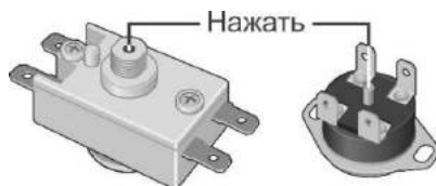
Рисунок 2. Схема расположения кнопки термовыключателя

Вышеперечисленные неисправности не являются дефектами ЭВН и устраняются потребителем самостоятельно или за его счет.