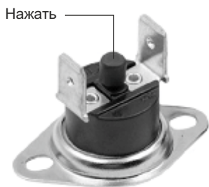
Рис. 2 Расположение кнопки термовыключателя.